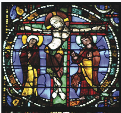
«Распятие». Витраж западного фасада собора Нотр-Дам в Шартре. 1145–55.

ВИТРА́Ж (франц. vitrage, от лат. vitrum – стекло), орнаментальная или сюжетная декоративная композиция (в окне, двери, перегородке, в виде самостоят. панно) из стекла или др. материала, пропускающего свет. В строит. практике В. также называют сплошное или частичное остекление фасада. Цветные В., заполняющие оконные проёмы, создают богатую игру окрашенного света и существенно влияют на эмоциональную выразительность интерьера. Судя по фрагментам плоского цветного стекла, найденным в Бени-Хасане (Египет) и Риме, простейшие В. существовали в Др. Египте со 2-го тыс. до н. э., а в Др. Риме – с 1 в. н. э. В раннехристианских базиликах Рима (Санта-Сабина, ок. 430) и Равенны (Сант-Аполлинаре-ин-Классе, 549) заполнением оконных рам служили алебастр и селенит, которые приглушали в интерьере яркий дневной свет и создавали своеобразный декоративный эффект благодаря игравшему в