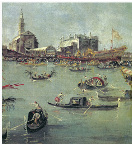
Ф. Гварди. «Праздник Вознесения»

место попыткам создания обобщённой картины мира, в которой человек существует в естеств. гармонии с поэтически-одухотворённой жизнью природы. В поздних произведениях Тициана раскрываются глубокие драматич. конфликты, живописная манера приобретает исключительную эмоциональную выразительность. В работах мастеров 2-й пол. 16 в. (П. Веронезе и Я. Тинторетто ) виртуозность передачи красочного богатства мира, зрелищность соседствуют с драматич. ощущением беспредельности природы и динамикой больших человеческих масс.