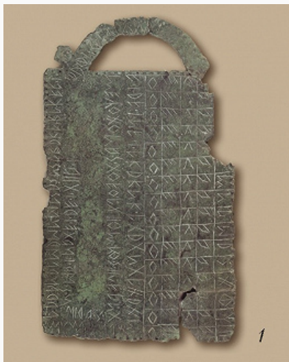
Венетский язык: 1 – табличка с алфавитом и посвятительной надписью из г. Эсте. Бронза. 5–4 вв. до н. э. Национальный музей Атестино (г. Эсте, Италия); 2 – прорисовка.