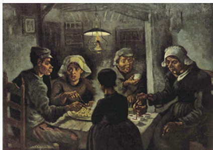
В. Ван Гог. «Едоки картофеля». 1885. Музей Ван Гога (Амстердам).

ВАН ГОГ (van Gogh) Винсент Виллем (30.3.1853, Грот-Зюндерт, пров. Сев. Брабант – 29.7.1890, Овер-сюр-Уаз, близ Парижа), голл. живописец и рисовальщик. Родился в семье пастора; не получил систематич. образования. В 1869–1876 служил комиссионером в гаагской фирме по продаже произведений искусства, посетил Брюссель, Лондон и Париж; в 1876 преподавал в школе в Рамсгите (Англия). В 1877 обучался в миссионерской школе в Лакене (близ Брюсселя), в 1878–79 занимался проповеднич. деятельностью среди горняков Боринажа (Бельгия). В эти годы В. Г. осознал своё призвание – стать художником униженных и обездоленных, изображая их тяжёлый труд. Недолго посещал АХ в