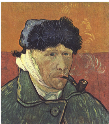
В. Ван Гог. «Автопортрет с перевязанным ухом». 1889. Собрание Ли Б. Блок (Чикаго).