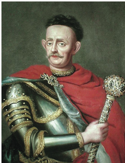
«Гетман Мазепа с булавой».

Портрет работы неизвестного художника. 18 в. Музей истории Запорожья (г. Запорожье).