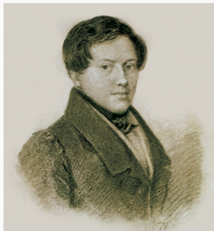
Е. А. Боратынский. Портрет работы Ж. Вивьена. 1826(?).

БОРАТЫ́НСКИЙ (Баратынский) Евгений Абрамович [19.2(3.3).1800, с. Вяжля Кирсановского у. Тамбовской губ. – 29.6(11.7).1844, Неаполь; похоронен в С.-Петербурге, на Тихвинском кладбище Александро-Невской лавры], рус. поэт. Воспитывался в петерб. Пажеском корпусе (1812–16), откуда был исключён с запретом иной службы, кроме солдатской. Формально не лишённый дворянских прав, он фактически не имел возможности их подтвердить до тех пор, пока не выслужит офицерский чин. В 1819 Б. вступил рядовым в гвардию и в течение года жил в С.-Петербурге, где познакомился с А. А. Дельвигом , который напечатал его первые стихотв. опыты [«Мадригал. Пожилой женщине и всё ещё прекрасной» (ж. «Благонамеренный», 1819, ч. 5, № 4) и др.]. Издатели журналов, где публиковались произведения Б., печатали его фамилию с «а» в первом слого (Баратынский), создав тем самым специфич. лит.