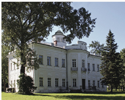
Большие Вязёмы. Усадебный дом. 1784.