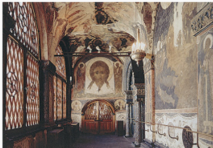
Благовещенский собор Московского Кремля. Роспись паперти. 1547–51.

БЛАГОВЕЩЕНСКИЙ СОБОР Московского Кремля, памятник рус.