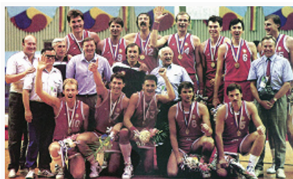
Сборная СССР – чемпион Олимпийских игр в Сеуле (1988).

1 – щит с корзиной; 2 – линия штрафного броска; 3 – линия трёх очков; 4 – трёхсекундная зона; 5 – боковая линия; 6 – центральная линия.