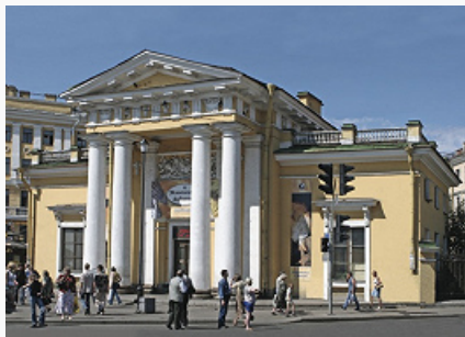
В. И. Беретти. Гауптвахта Сенного рынка в С.-Петербурге. 1818–20.