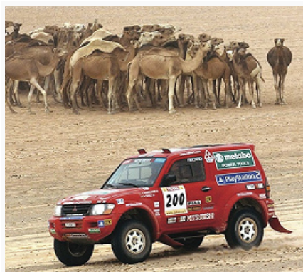
Эпизод ралли «Париж – Дакар». 2004.

Заезды на время проводятся на коротких кольцевых трассах, преим. на автодромах. Многие рекорды на время и на дальние дистанции в сер. 20 в. установлены на автодроме Монлери близ Парижа. Заезды на короткие дистанции проводятся обычно на естеств. треках, имеющих гладкую и твёрдую поверхность, как, напр., дно высохшего соляного озера близ г. Солт-Лейк-Сити (США).