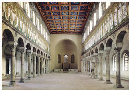
Базилика Сант-Аполлинаре Нуово в Равенне. 6 в.

БАЗИЛИКА (лат. basilica , от греч. βασιλική; стоа́, букв. – царская колоннада), вытянутое, прямоугольное в плане здание, разделённое внутри продольными рядами колонн или столбов на несколько (б. ч. нечётное количество) частей – т. н. кораблей ( нефов ), имеющих самостоят. перекрытия; средний гл. неф всегда выше боковых, так что верхняя часть его стен, прорезанная окнами, выступает над крышами боковых нефов. При входе в Б. – поперечный притвор (или нартекс), а в противоположном конце среднего, большего по ширине, нефа – полукруглый выступ ( апсида ). Предположительно, как тип здания возникла в результате развития др.-греч. стои , использовавшейся для заседаний архонта- басилея . Ранние образцы находятся в Риме (2 в. до н. э.); позднее получила распространение на всей территории др.-рим. государства. Б. служили для совершения деловых операций и судебных заседаний. Возводились в воен. лагерях для собраний гарнизона, в дворцовых ансамблях – как зал приёмов. Первоначально имели дерев. открытое перекрытие, позднее заменённое каменным сводчатым (в т. ч. в базилике Максенция в Риме, 4 в.). Форма Б. была усвоена раннехристианской архитектурой, в дальнейшем она широко