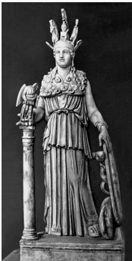
«Афина Варвакион». Римская копия 3 в. со статуи Фидия «Афины Парфенос» (438 до н. э.). Национальный музей (Афины).

А. изображали, как правило, в виде суровой и величественной девы в шлеме, с копьем, щитом – эгидой (статуя А. с зап. фронтона храма Афины Афайи на о. Эгина, ок. 500 до н. э.). Знаменитая гигантская хрисоэлефантинная скульптура «Афина Парфенос» работы Фидия для Парфенона на афинском Акрополе (поставлена в 438 до н. э.) не сохранилась; о ней можно судить по позднейшим копиям и репликам («Афина Варвакион», мрамор, 3 в., Нац. музей в г. Афины, и др.). «Афина Лемния», также выполненная Фидием для афинского Акрополя, изображала умиротворенную богиню, олицетворявшую миролюбивый политич. курс Афинского гос-ва того времени; к его статуе «Афина Промехос» восходит, возможно, «Афина Медичи» (Лувр, Париж). Сохранилось ок. 10 рим. реплик в мраморе бронзовой скульптурной группы «Афина и Марсий» Мирона (сер. 5 в. до н. э.). Отд. сцены мифов об А. часто изображались в вазописи, входили в скульптурное убранство храмов (рождение А. из головы Зевса, её спор с Посейдоном за обладание землей Аттики – на фронтонах Парфенона). А. предстаёт в сценах гигантомахии (фриз Пергамского алтаря, ок. 180 до н. э.; Пергамон-музей, Берлин), с Гераклом (метопа храма Зевса в Олимпии, сер. 5 в. до н. э.). В живописи Возрождения фигура А. использовалась в разл. аллегориях , олицетворяя мудрость (в многофигурных композициях «Парнас» – А. Мантенья , Рафаэль и др.), добродетель и целомудрие («Паллада и кентавр» С. Боттичелли , около 1483, галерея Уффици,