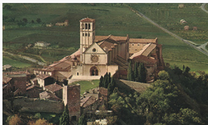
Ассизи. Монастырский комплекс Святого Франциска.