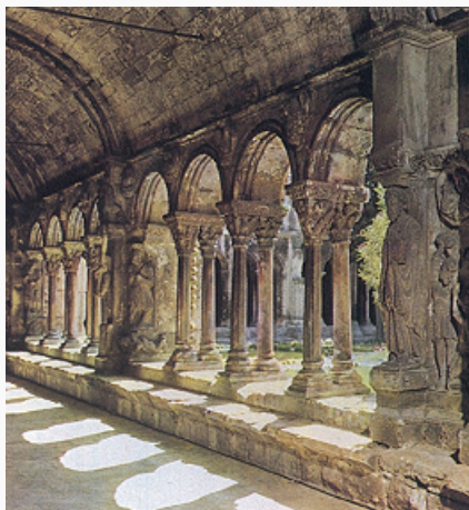
Арль. Клуатр церкви Сен-Трофим. 12 в.