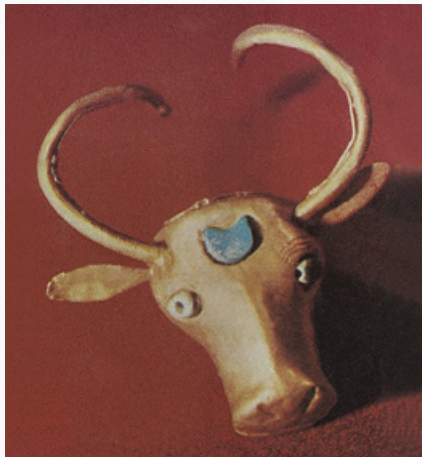
Золотая головка быка из Алтын-депе.